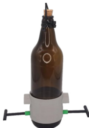
Cerveja 600 Ambar