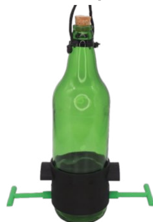
Cerveja 600 Verde